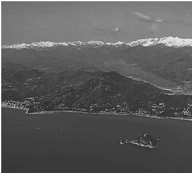
L'ILLA GALLINÀRIA, SITUADA DAVANT D'ALBENGA, ON ES TROBAVA EL MONESTIR DE SAN MARTINO.